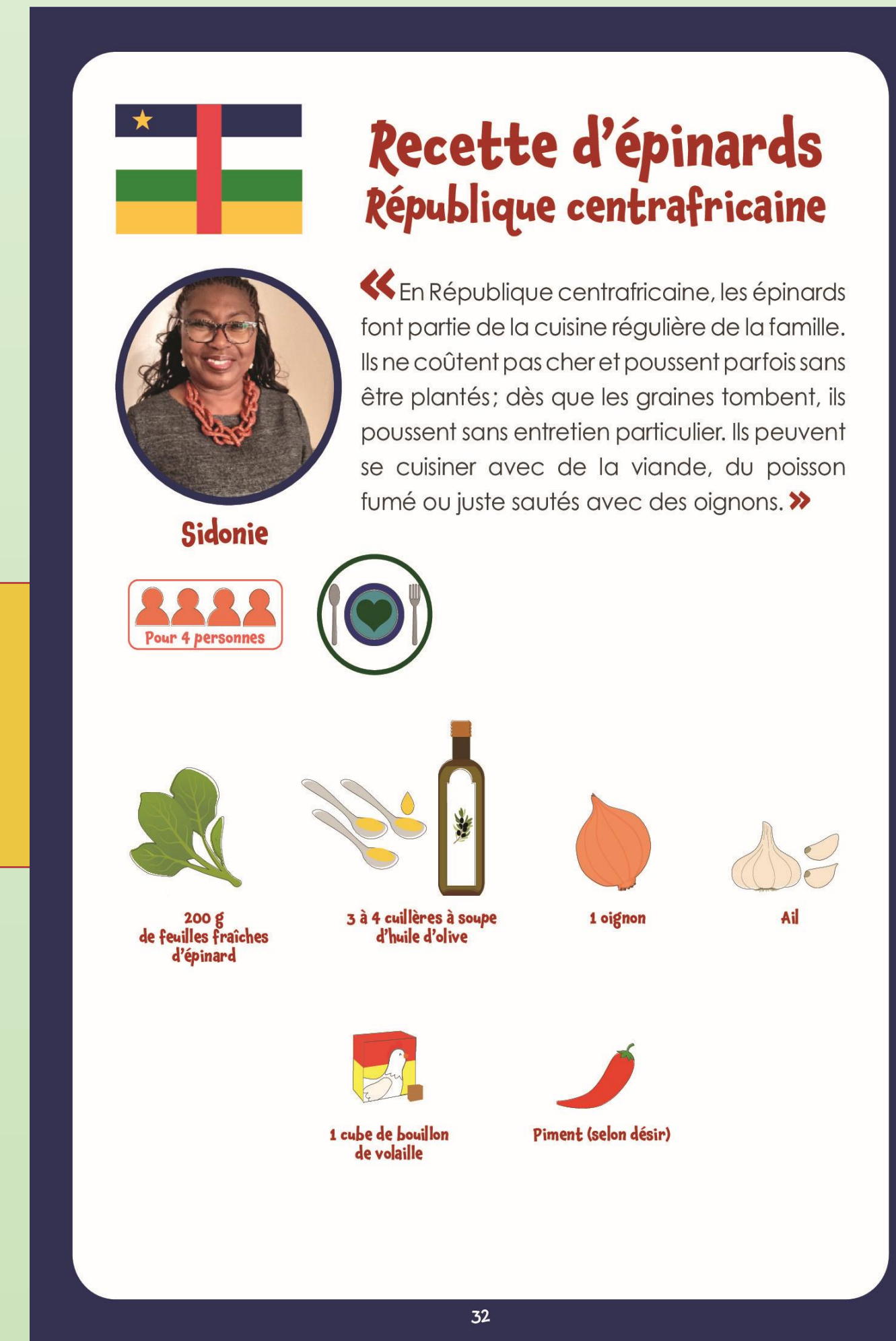
La 3ème partie présente des recettes données par les différents soignants ainsi qu'une cheffe étoilée, et équilibrées par la diététicienne