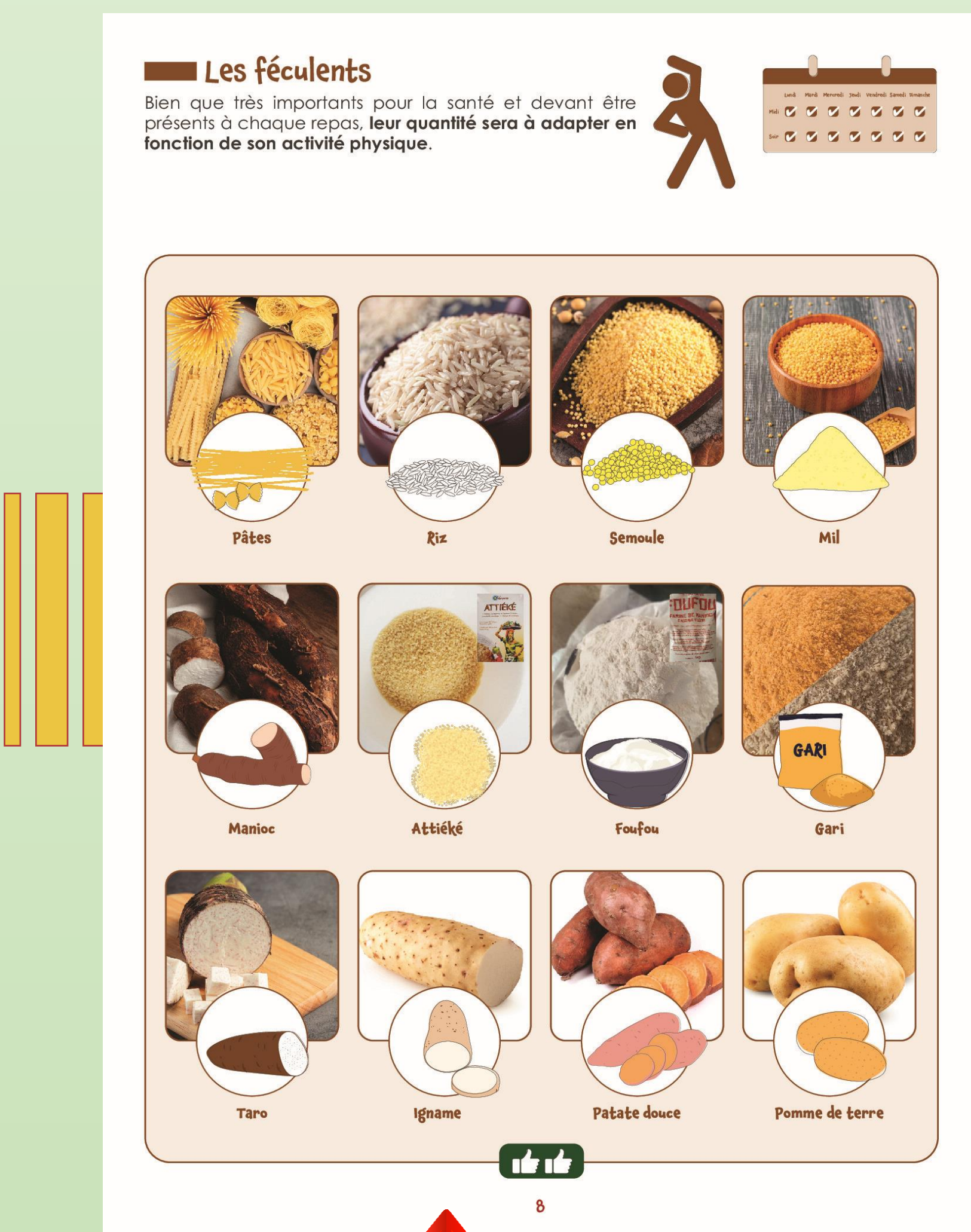
Une 1ère partie regroupe des conseils alimentaires intégrant des aliments fréquents dans la cuisine africaine