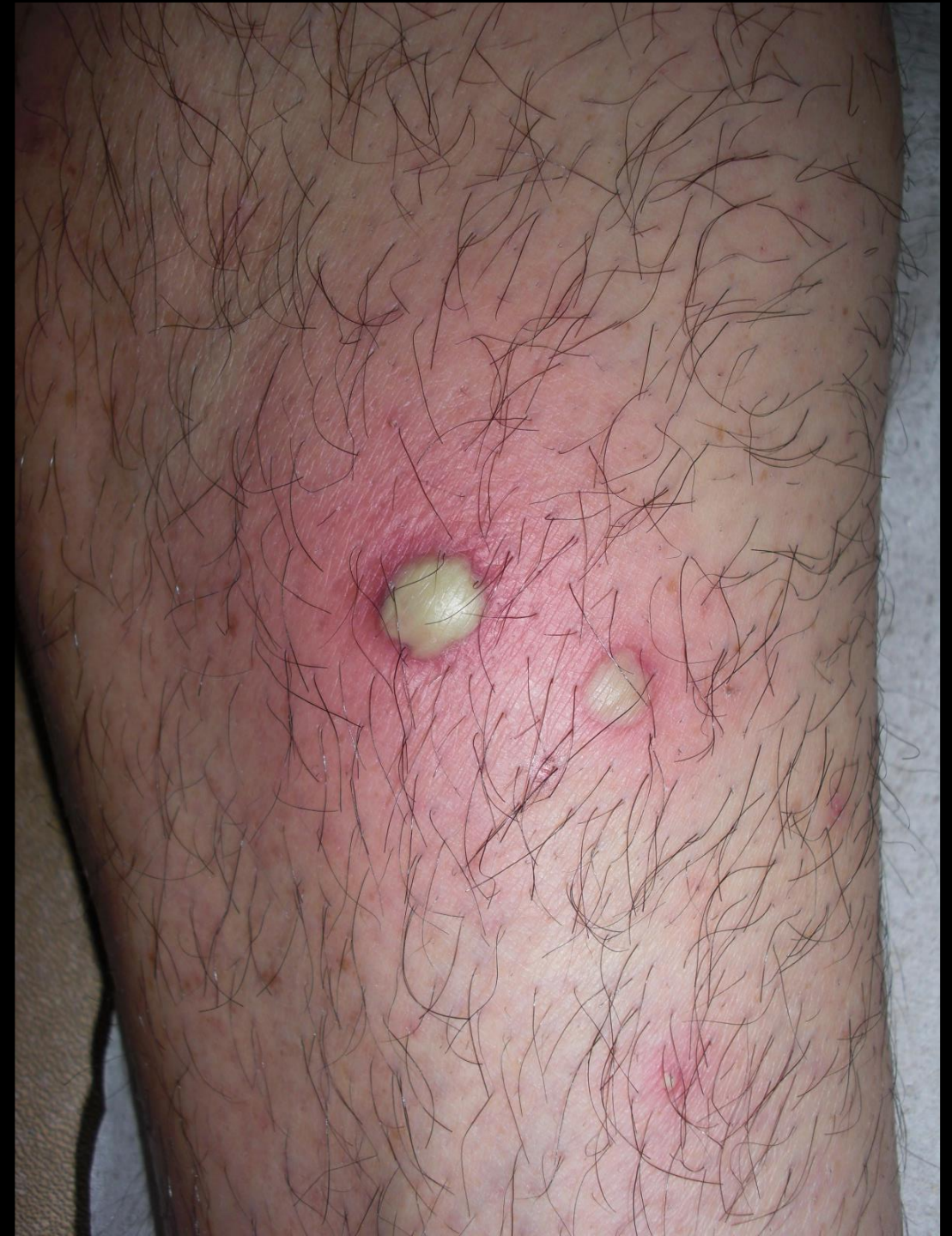
Impétigo (streptocoque A)