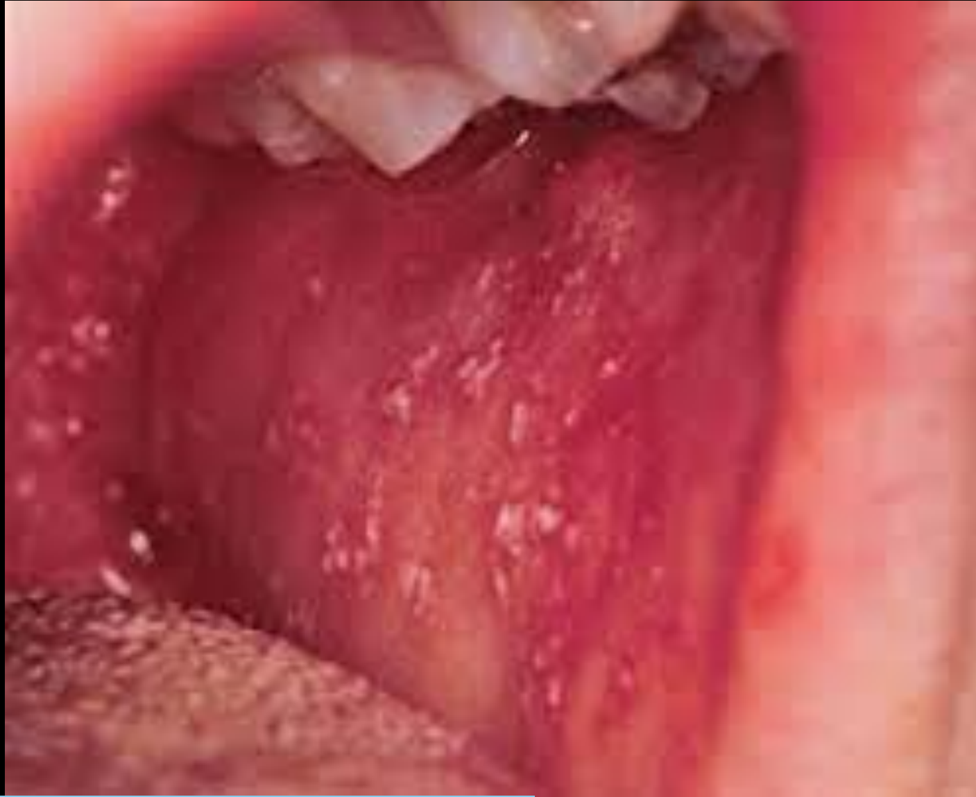
Rougeole (signe de Köplick)