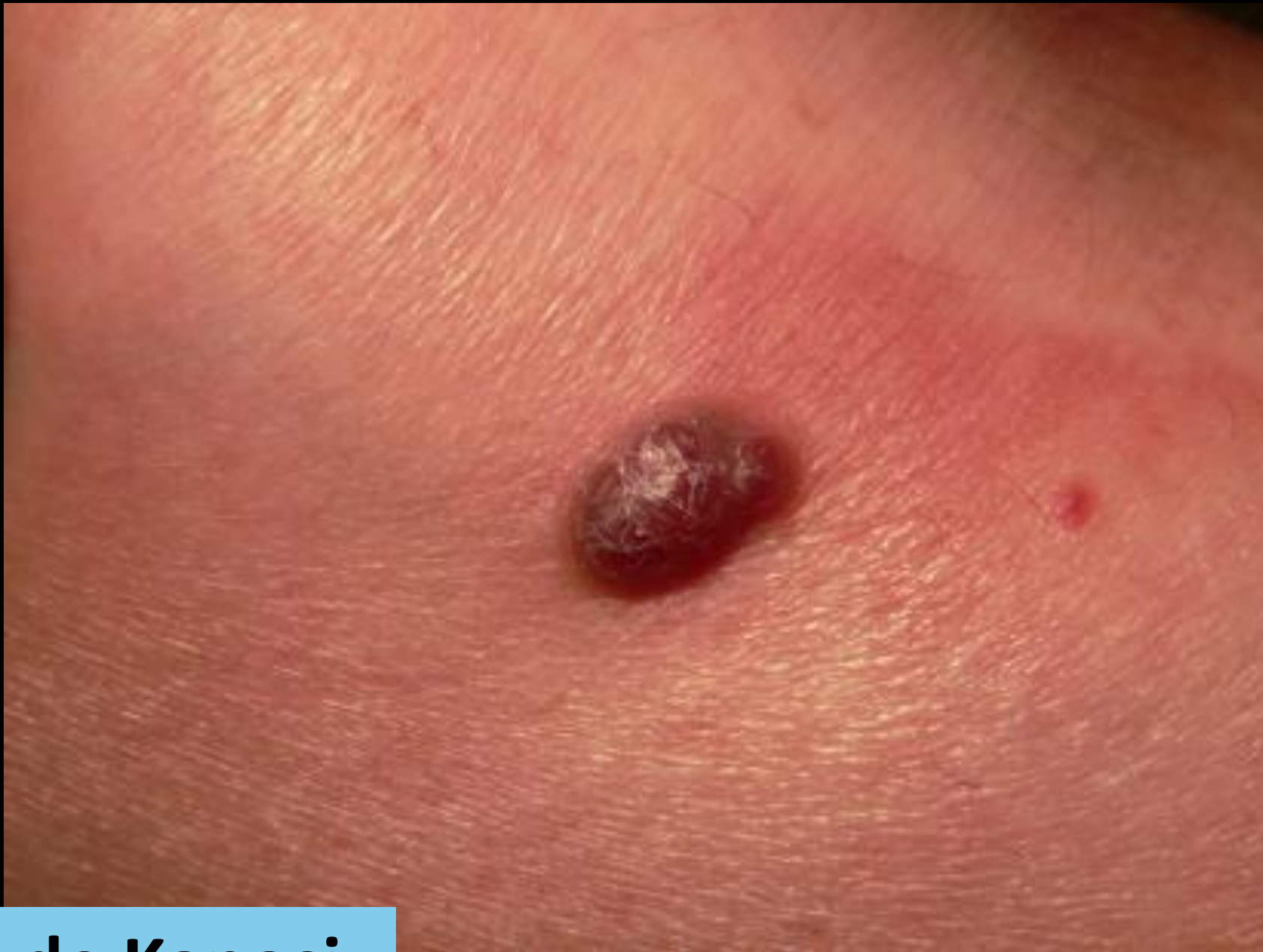
Maladie de Kaposi