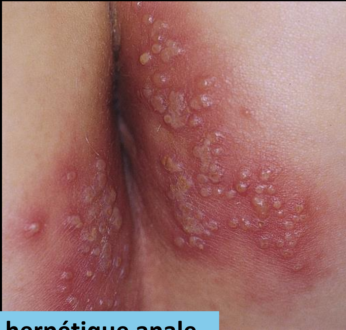
Récurrence herpétique anale