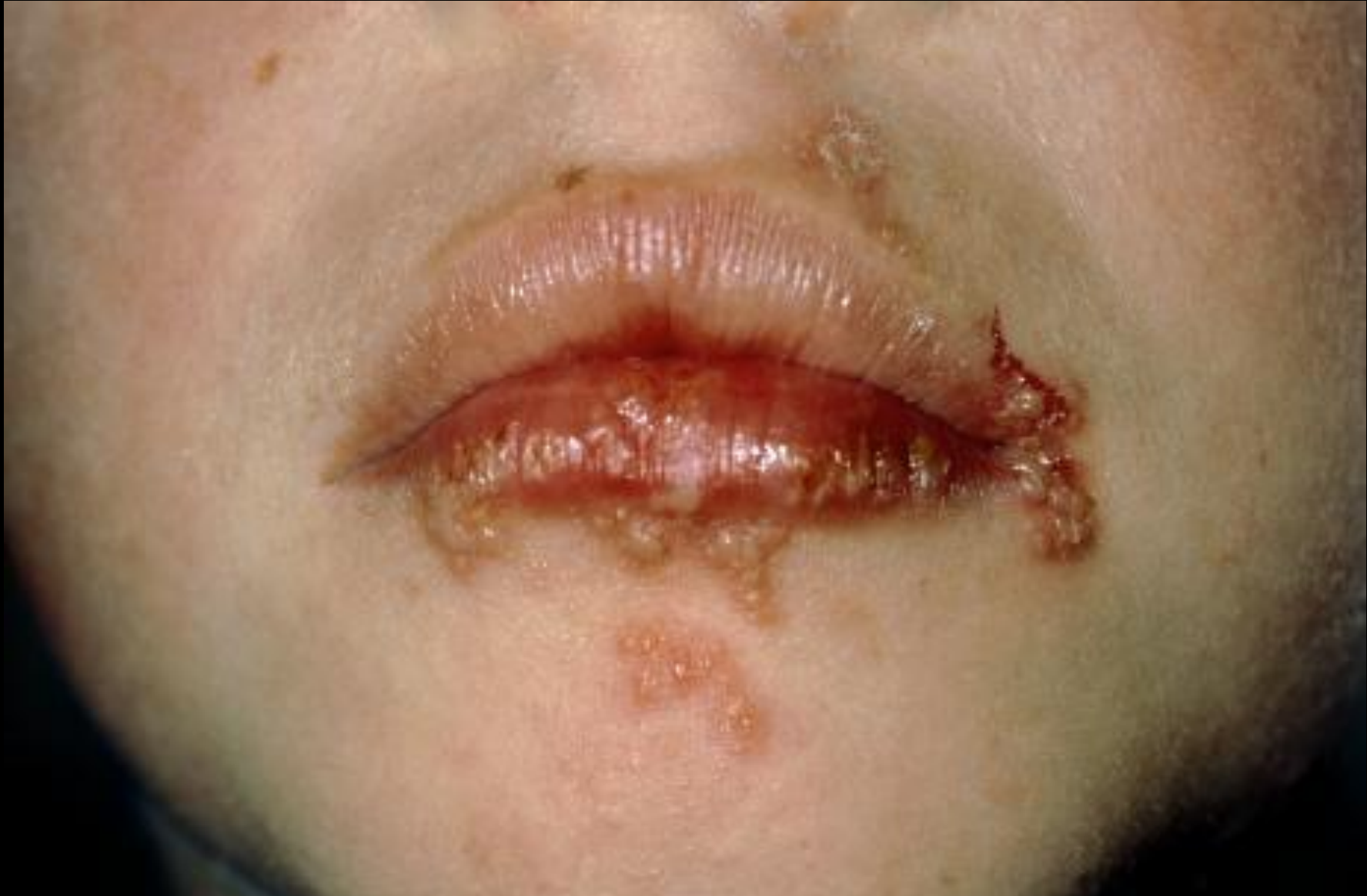
Primo-infection à HSV (gingivo-stomatite)