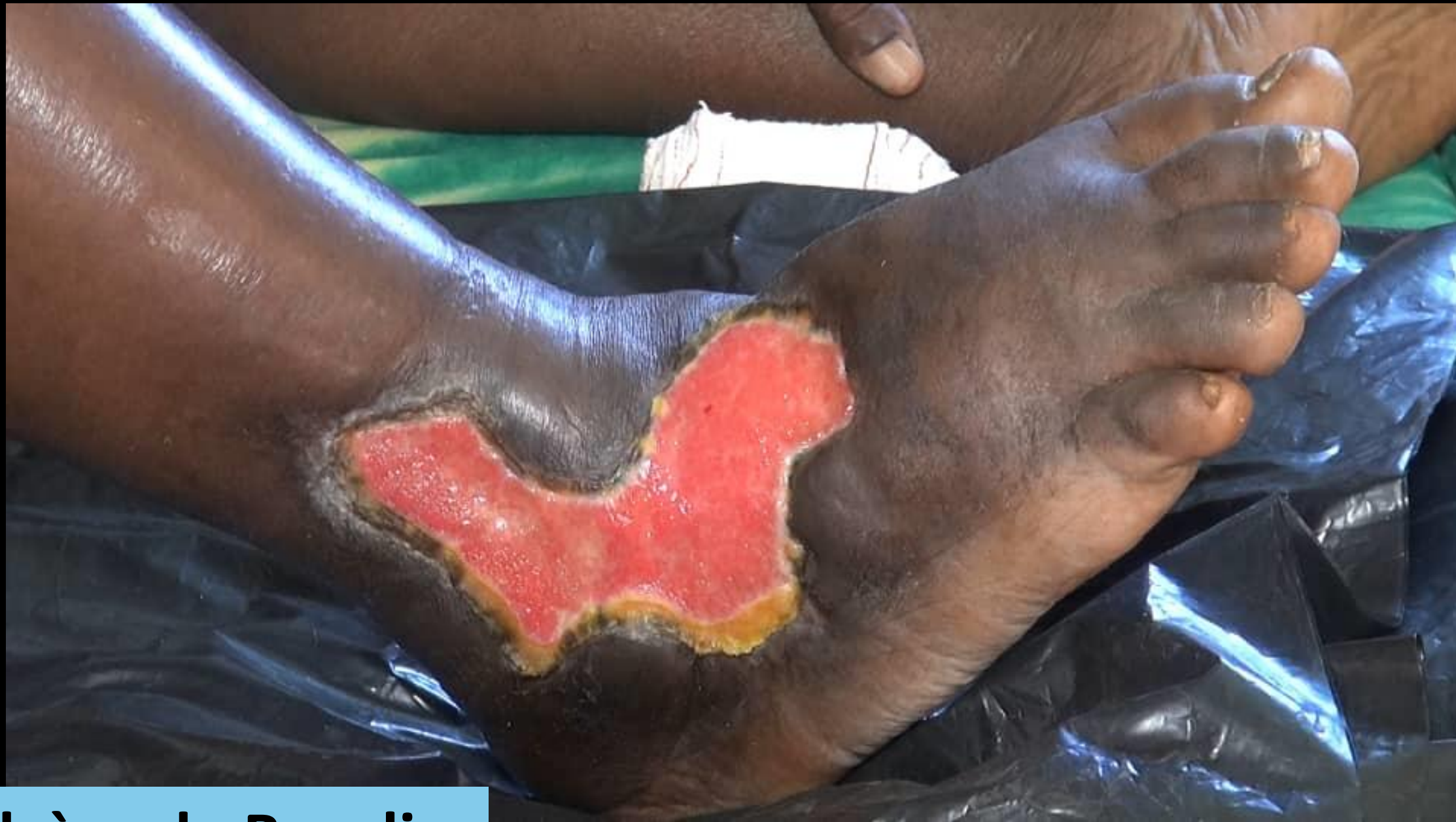
Ulcère de Buruli