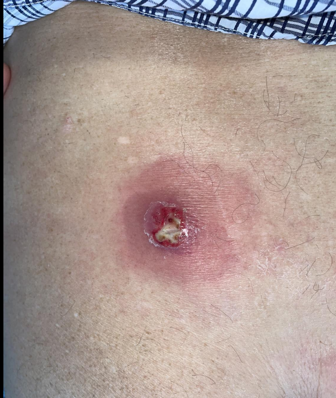
Furoncle abcédé, staphylocoque doré PVL+