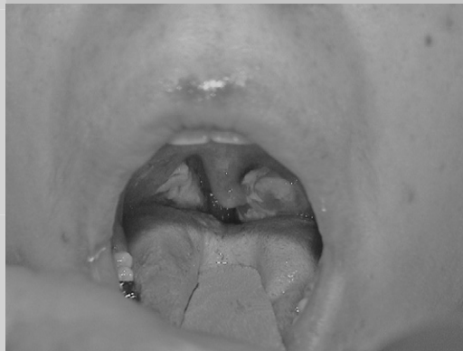
P-149-1 : Angine érythémato-pultacée